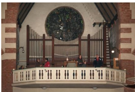
Tijdens de start van de casco restauratie op 22 december 2010 bezochten diverse mensen de orgelgalerij met het Steinmeyer-orgel.

Binnen enkele weken werd een aannemer gecontracteerd en kon BOEi op 22 december 2010 de casco restauratie starten, krap voor de deadline uit de subsidiebeschikking. Er waren nog wel enkele weken na die datum nodig om alle zaken tussen BOEi, het Bisdom Haarlem en de gemeente Hilversum te regelen en contractueel vast te leggen.