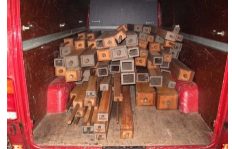
De houten pijpen op transport naar Hillegom.