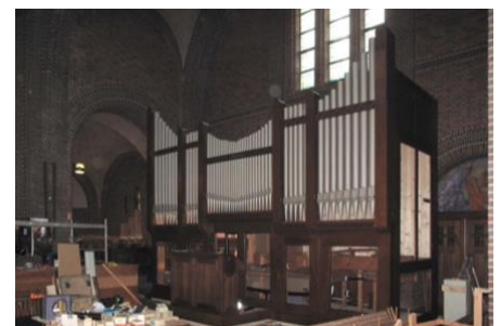
In juni 2012 was de opbouw van het orgel in de Bussumse Mariakerk al een heel eind gevorderd.