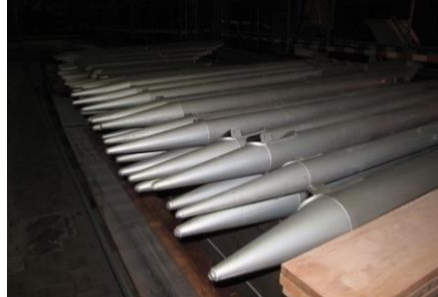
De vele metalen frontpijpen werden op de kerkbanken gelegd, wachtend op transport.