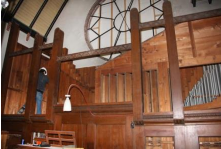
In november 2011 werd het Steinmeyer-orgel gedemonteerd en naar Adema's Kerkorgelbouw in Hillegom getransporteerd

Gelukkig was in de aan het bisdom verstrekte subsidiebeschikking de mogelijk open gelaten dat deze zou kunnen worden overgedragen aan een eventuele volgende eigenaar. Dat gold voor de kerk, maar dus ook voor het orgel. Omdat het orgel niet in Hilversum maar in Bussum zou worden herbouwd vergde het nog wel wat overredingskracht, maar uiteindelijk bleken de collega's bij de rijksdienst het er mee eens te zijn dat het gerestaureerde orgel niet in Hilversum maar in Bussum werd herbouwd.