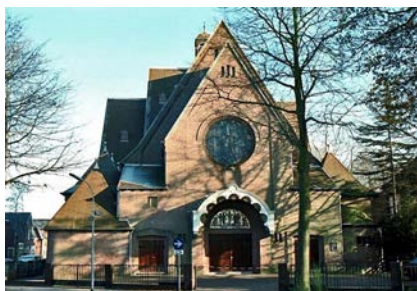
Clemenskerk te Hilversum

In 1923 mochten er nog geen orgelconcerten plaatsvinden in de Rooms-katholieke kerken. Het orgel is in gebruik genomen en gewijd tijdens de mis. Na de mis heeft de organist nog een aantal stukken gespeeld om het orgel goed te laten horen, maar dat was dus geen officieel concert.