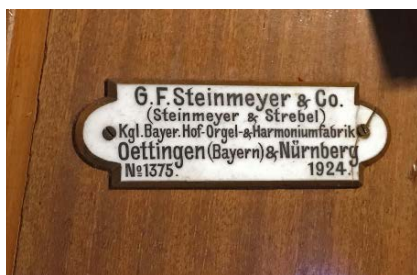
Het Steinmeyer-orgel 1924/1375