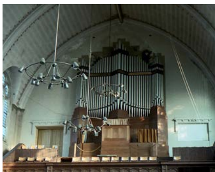
Het Steinmeyer-orgel van de Prinsessekerk in Amsterdam