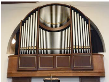
Het Steinmeyer/Pels-orgel van de Grote Kerk in Papendrecht

Ja, daar ben ik ooit geweest. Dit instrument is helaas in de loop der jaren flink verbouwd en veranderd. Er is nog wel iets van de Steinmeyer-klank herkenbaar en het blijft een fraai klinkend instrument, maar het is geen authentiek Steinmeyer orgel meer.