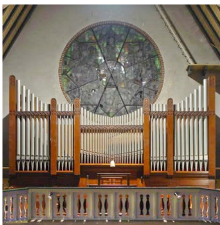
Het front van het Steinmeyer-orgel van de H. Clemenskerk op zijn oorspronkelijke locatie in 2005

Na de afbraak van de Prinsessekerk in 1982 bezocht ik met mijn toenmalige bureau de Clemenskerk in Hilversum, die vlak bij ons in de buurt stond. Ik was nog nooit in die kerk geweest en toen ik het orgel hoorde, dacht ik: 'Wat is fraai orgel, het klinkt erg goed!' Maar ik wist niet wie de bouwer was. Na afloop van de mis ben ik naar boven gelopen en heb toen kennis gemaakt met de organist. Er zat wel een naamplaatje op het orgel maar er hingen papertjes overheen. Toen ik deze papertjes optilde ontdekte ik de naamplaat van de firma Steinmeyer. Voor mij een hele ontdekking want ik wist toen nog niet dat er, naast de orgels van de Prinsessekerk en de Adventskerk in Alphen a/d Rijn in Nederland nog meer Steinmeyer-orgels bestonden. Een Steinmeyer-orgel vlak bij mijn huis, wat een toeval! ►