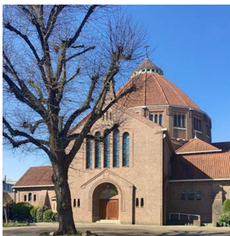
Koepelkerk/Mariakerk te Bussum

En toen verhuisde het orgel naar de Koepelkerk.