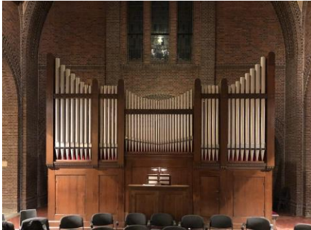
Het Steinmeyer-orgel in de Koepelkerk/Mariakerk te Bussum

De klank van het instrument is dezelfde als destijds in Hilversum, het is zeer herkenbaar, want het heeft een erg karakteristieke klank. Je hoeft alleen maar een paar tonen te horen en weet je al welk orgel het is. Maar het orgel is natuurlijk gebouwd voor een plek op een orgelbalkon, waarbij het geluid eigenlijk over je heen komt. Ik vind het jammer dat het geluid veel directer is in de Koepelkerk, dat komt mede door plaatsing direct onder de koepel, die het geluid nog versterkt. De klank ervaar je nu als wat brutaler en luider. In de Clemenskerk stond het boven en de kerk had een houten gewelf. De mooie akoestiek en plek van het orgel in de kerk zorgde ervoor dat de klank wat gemengder en beschaafder werd ervaren. Maar ook in de Koepelkerk is het duidelijk dat het een orgel van grote klasse is!