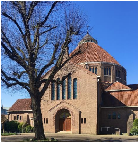
Koepelkerk/Mariakerk te Bussum