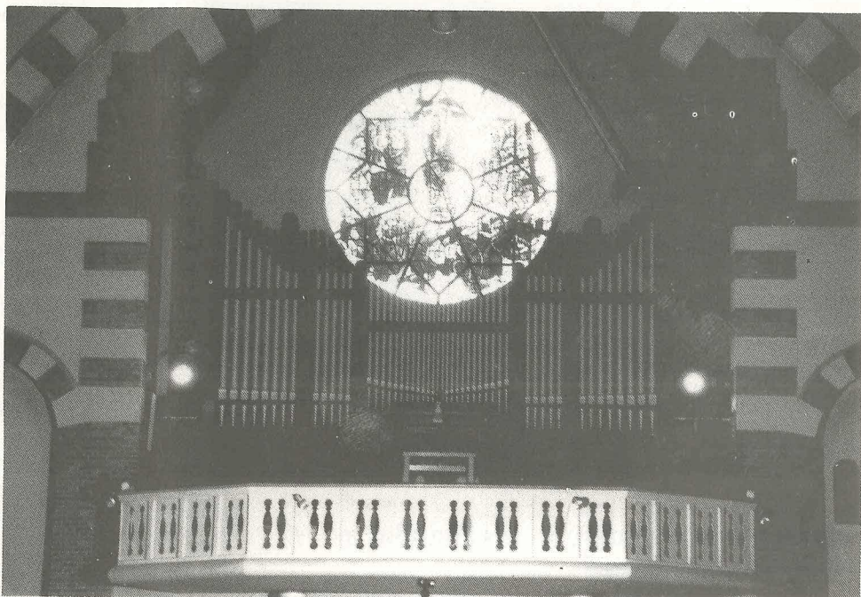
Het Steinmeyer-orgel

Wat Van Ditzhuizen had voorzien in 1913 werd in 1920 een noodzaak; wegens de groei van de parochie moest de kerk nodig worden uitgebreid. Na allerlei acties was het benodigde geld voor de uitbouw verzameld zodat aan architect Jos Cuypers de opdracht