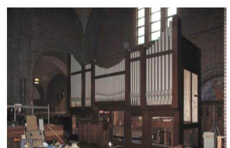
In juni 2012 was de opbouw van het orgel in de Bussumse Mariakerk al een heel eind gevorderd.