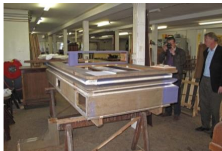
Ook de grote magazijnbalg van het orgel werd grondig gerestaureerd.