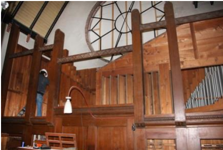
In november 2011 werd het Steinmeyer-orgel gedemonteerd en naar Adema's Kerkorgelbouw in Hillegom getransporteerd

Gelukkig was in de aan het bisdom verstrekte subsidiebeschikking de mogelijk open gelaten dat deze zou kunnen worden overgedragen aan een eventuele volgende eigenaar. Dat gold voor de kerk, maar dus ook voor het orgel. Omdat het orgel niet in Hilversum maar in Bussum zou worden herbouwd vergde het nog wel wat overredingskracht, maar uiteindelijk bleken de collega's bij de rijksdienst het er mee eens te zijn dat het gerestaureerde orgel niet in Hilversum maar in Bussum werd herbouwd.