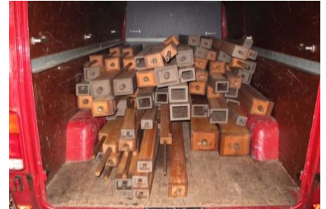
De houten pijpen op transport naar Hillegom.