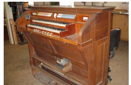
De speeltafel in de werkplaats van de orgelbouwer. De restauratie hiervan moest nog de nodige aandacht krijgen.