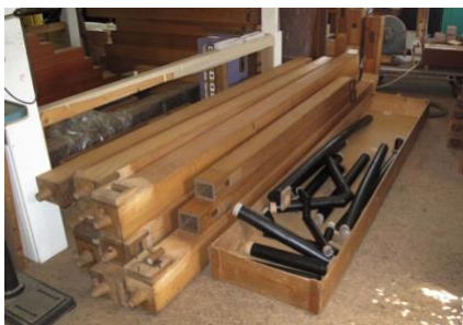
De partij houten pijpen in de werkplaats van de orgelbouwer.