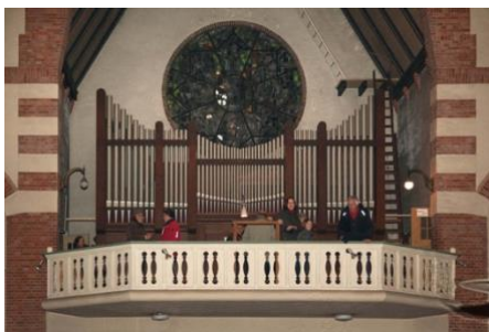
Tijdens de start van de casco restauratie op 22 december 2010 bezochten diverse mensen de orgelgalerij met het Steinmeyer-orgel.

Binnen enkele weken werd een aannemer gecontracteerd en kon BOEi op 22 december 2010 de casco restauratie starten, krap voor de deadline uit de subsidiebeschikking. Er waren nog wel enkele weken na die datum nodig om alle zaken tussen BOEi, het Bisdom Haarlem en de gemeente Hilversum te regelen en contractueel vast te leggen.