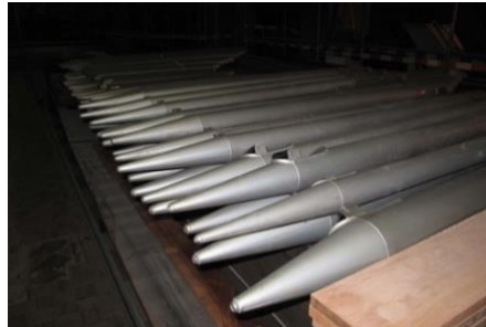
De vele metalen frontpijpen werden op de kerkbanken gelegd, wachtend op transport.